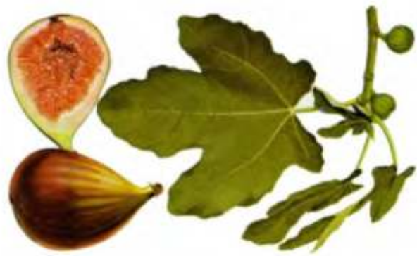
Tabela Nutricional da Figo